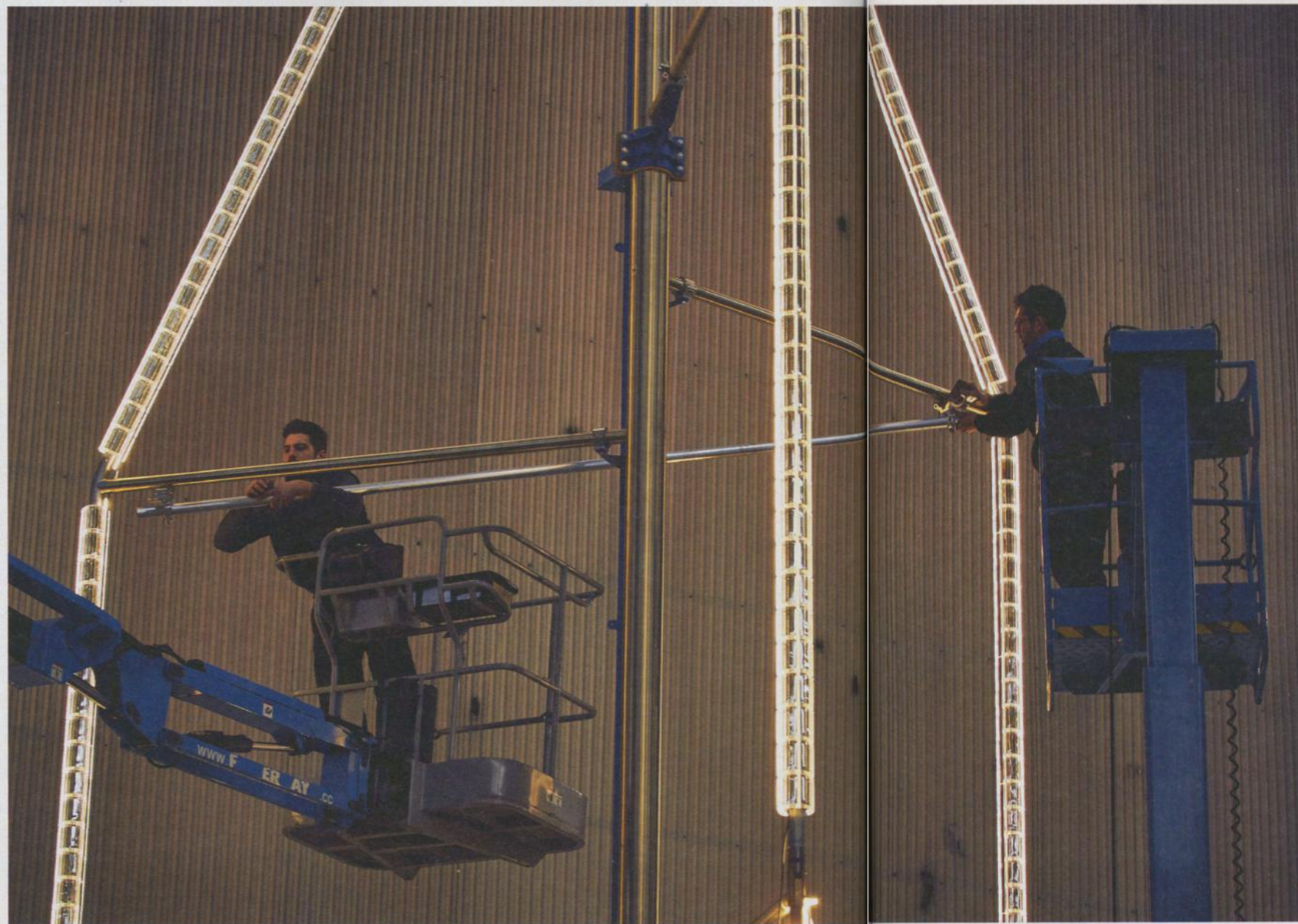
CI-CONTRE ET CI-DESSOUS Intégrées au cristal, 40 000 LED illuminent les six fontaines.

Créée en 2015 par la Mairie de Paris, le Fonds pour Paris s'est donné pour mission de restaurer et de dynamiser le patrimoine de la capitale grâce à des pièces d'art contemporain. Intégralement financé par le mécénat, il inaugurerà en septembre le bouquet de tulipes de Jeff Koons, sculpture géante dressée en mémoire des victimes des attentats du 13 novembre 2015. Dans un futur proche, il prévoit